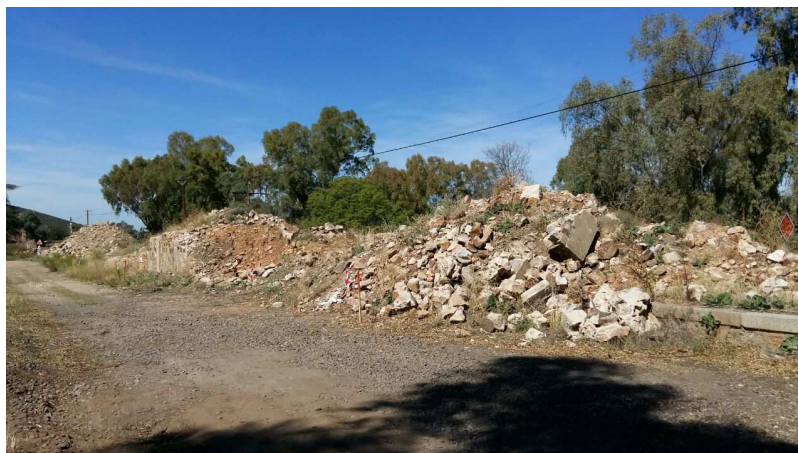
Fotos realizadas después de la demolición, el día 27-9-2023