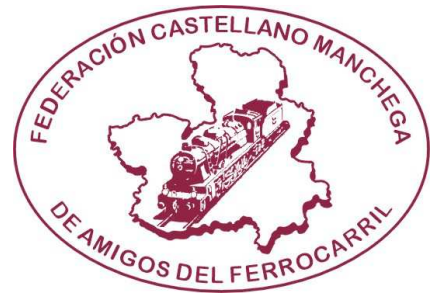
Logo Federación nº 2